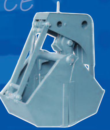
Benne mono câble